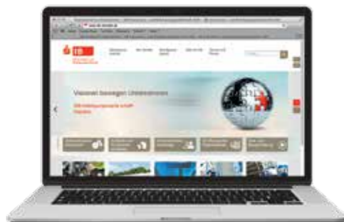
Überarbeitetes Logo, neues KeyVisual und neuer Auftritt

Sprechen Sie uns gerne an! Ihr Team der SIB